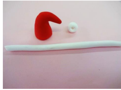
【作り方⑩】 白い粘土を丸めて、つまようじで 穴を開けボンドを付け差し込む。 帽子のふちは、長く伸ばして巻 き付ける。