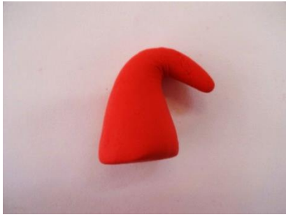
【作り方⑨】 先を曲げます。