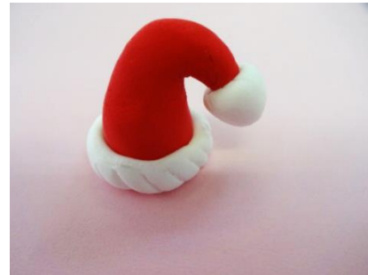
【作り方⑫】 帽子の出来上がり♪ 帽子の底にボンドをつけて、 雪だるまの頭に乗せます。