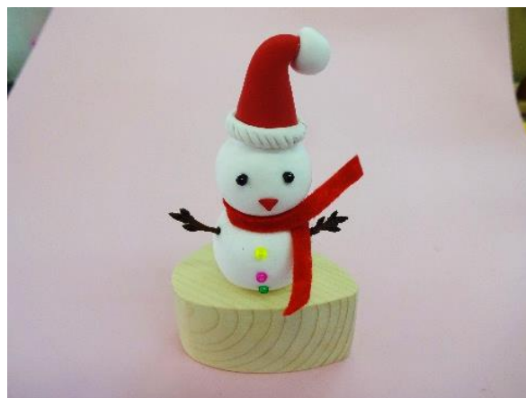
完成です。 木の株などに乗せるとかわいいです♪